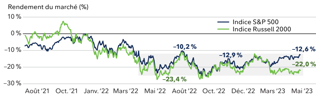
TABLEAU 1 : Le marché a passé une année dans les limbes

Le marché semble manquer d'orientation depuis le mois de juin de l'an dernier. Cela est particulièrement long, et j'en viens à me demander si la vigueur de l'indice S&P 500® des dernières semaines indique que le prochain (ou l'actuel) marché haussier s'est enfin concrétisé.